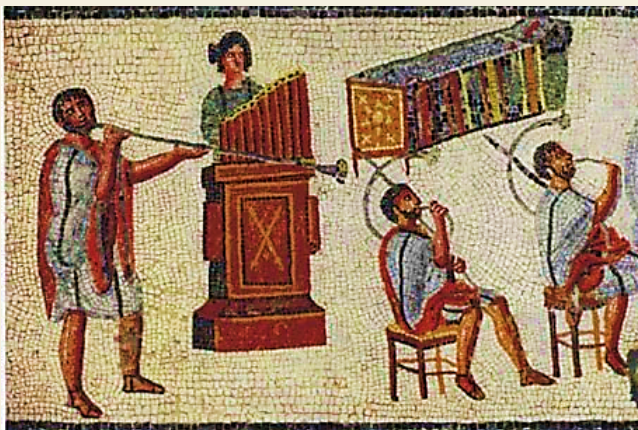
Orgue hydraulique (musée Jamahiriya à Tripoli)

L'orgue hydraulique était très répandu dans le monde antique : les grecs, les romains, les égyptiens savaient le construire et l'utiliser.