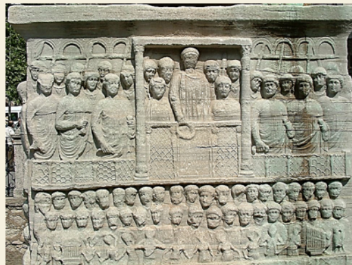
L'empereur Théodose remet la couronne de laurier au vainqueur. Piédestal (IVe s.) de l'obélisque de Théodose, sur l'hippodrome de Constantinople. On distingue bien l'hydraulos ou hydraule, en bas à droite.