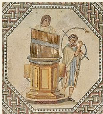
Mosaïque d'une villa romaine de Nennig (Allemagne), fin du IIIème siècle.

L'orgue disparut quasiment dans tout l'occident chrétien jusqu'au Xème siècle environ sous l'influence des premiers "pères" de l'église qui considéraient cet instrument comme un objet païen.